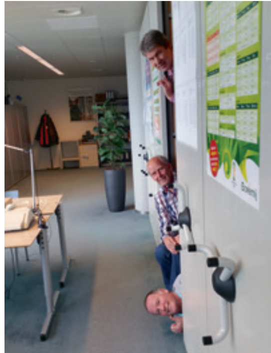
De zoekers van archief en bibliotheek hjaalen alles boven water