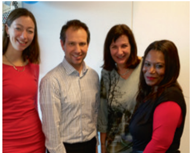
De boekhoudkundige ondersteuners