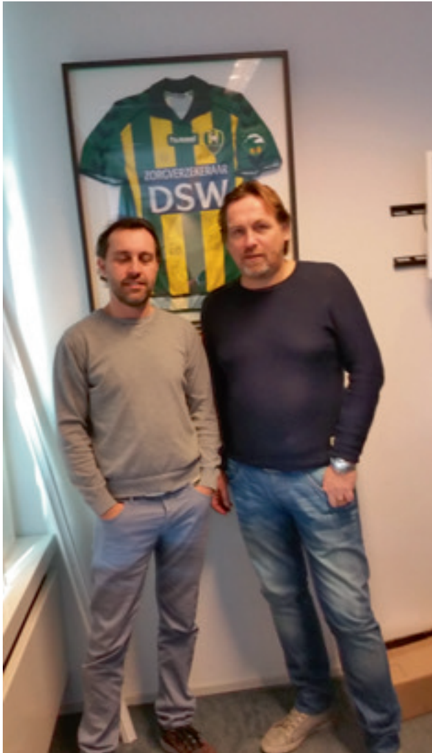
Als daar geen Systeem in zit